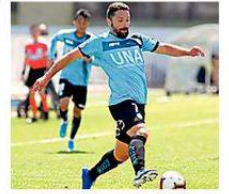
EL TEMUCUENSE JUGÓ EN IQUIQUE.