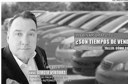
LA ACTIVIDAD SERÁ DICTADA POR PROFESIONAL DE LA VENTA AUTOMOTRIZ.

El webinar se realizará el día 14 de mayo a las 20 horas a través de la plataforma Zoom y Facebook Live. La actividad será dictada por Sergio Verdura, profesional de la venta auto-