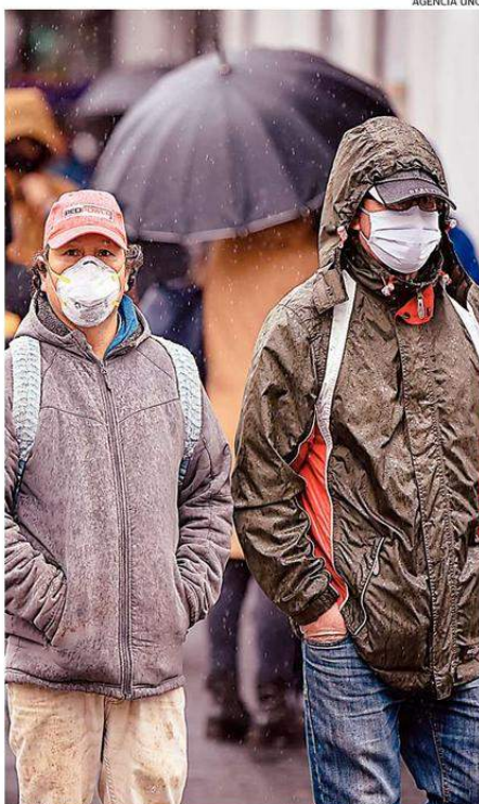
UNA INCIDENCIA ACUMULADA MÁS ALTA QUE TEMUCO, PRESENTA SAAVEDRA.

Por ello, a juicio del parlamentario, la comuna reúne todas las condiciones para que se decrete una cuarentena total en el radio urbano. "Creo que claramente hay que hacer una cuarentena, pero del núcleo urbano pa-