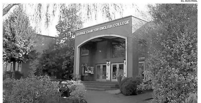
SE ACOGIÓ LA APELACIÓN REALIZADA POR EL ESTABLECIMIENTO EDUCACIONAL PRIVADO.

privado y dejó sin efecto la medida precautoria que en abril de este año había congelado los pagos de los apoderados que presentaron el recurso de protección durante la tramitación del mismo. ☞