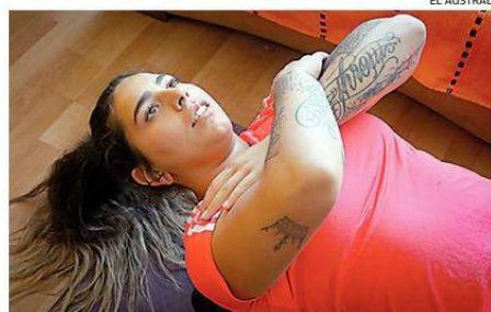
EN SUS CASAS ENTRENAN LOS DEPORTISTAS REGIONALES.