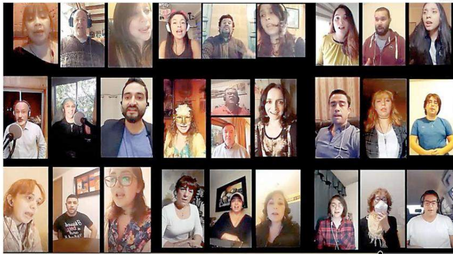
EL CORO ESTÁ REALIZANDO ENSAYOS ONLINE PARA PREPARAR UNA PROGRAMACIÓN ESPECIAL DE VIDEOS QUE IRÁN APARECIENDO DURANTE EL AÑO.

De esta manera el Programa de Extensión Musical con el que cuenta la UCT desde 2012 y que tiene cerca de 30 actividades anuales, continúa desarrollándose a la emergencia sanitaria, pero online, adaptando así sus funciones que tienen como principal objetivo enriquecer el aprendizaje de los alumnos con clases magistrales de músicos, la creación de asignaturas complementarias, con-