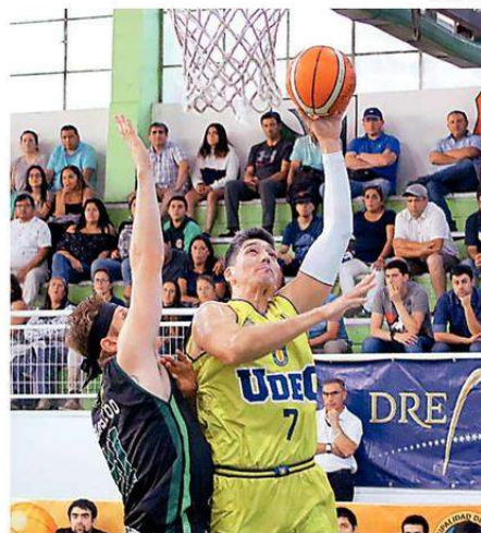
EL BÁSQUETBOL ESTÁ ENFRENTADO CON EL CANAL QUE LO TRANSMITE.

bre de 2018 y que, a visión de la LNB, se basa en “repetidos y graves incumplimientos del CDO en los pagos pactados entre las partes y que, al día de hoy, superaron ya con creces tiempos de respuesta razonables. En rigor, hay diez facturas que no han sido canceladas, con moras que van desde 90 a 355 días”. Dichos montos se refieren a pagos por derechos de televisión de cuatro cuotas de la temporada 2017-2018 y seis vencidas de 2019-2020. CS