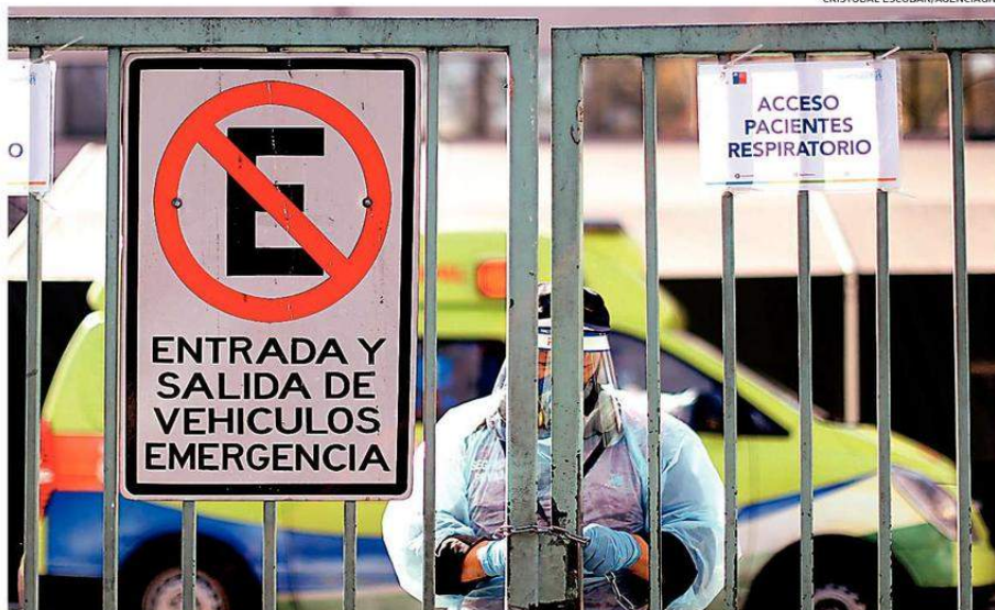
EL HOSPITAL SAN JOSÉ, EN LA REGIÓN METROPOLITANA, ES UNO DE LOS CENTROS DE SALUD QUE ESTÁ AL BORDE DE SU CAPACIDAD CRÍTICA.

También advirtió que "durante las primeras semanas de esta pandemia habíamos visto una reducción en la cantidad de personas que asistían a las