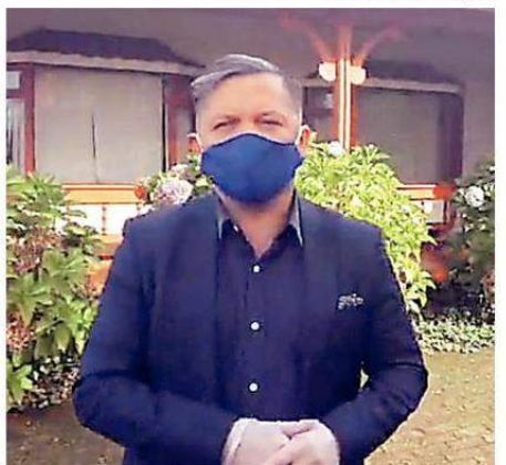
EL ALCALDE DE PITRUFQUÉN REALIZÓ UN LLAMADO A EXTREMAR LAS MEDIDAS DE PROTECCIÓN PARA EVITAR CASOS DE CORONAVIRUS.

"Por lo pronto, nosotros mantenemos sanitador individual en el frontis de la municipalidad. Continuamos con los controles sanitarios para ingresar a la comuna y además contamos con portales para la desinfección de vehículos y camiones. Asimismo, estamos trabajando en el proyecto de un almacén popular, de huertos comunitarios, acciones que, esperamos, nos permitan ir aplacando las necesidades de los vecinos".