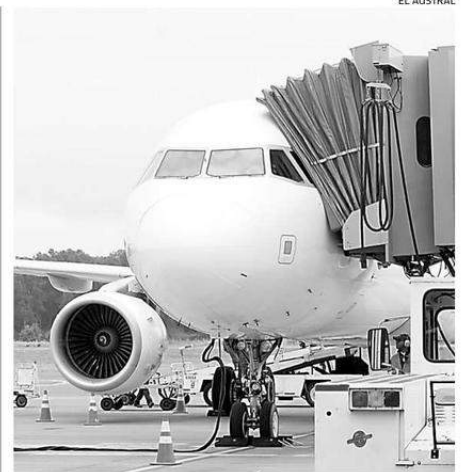
EL INGENIERO COMERCIAL ES INVESTIGADO POR LA FISCALÍA.

La autoridad, además, señaló que “el llamado esa que el público sea prudente, para que una vez que estén las condiciones para que los demás comercios vayan abriendo, se visiten cultivando una cultura de autocuidado que implique poder acceder a bienes y servicios no exponiendo la salud, por ende la recomendación va a ser que vaya solo un integrante por familia, sin la compañía de niños, adultos mayores ni personas con enfermedades crónicas e intentando minimizar las afluencias a solo lo estrictamente necesario”. ☞