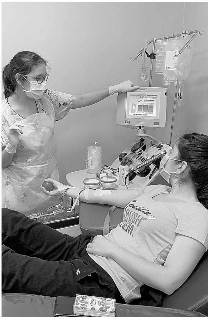
PARA REALIZAR DONACIONES DE SANGRE SE PUEDE COMUNICAR AL NUMERO 45-2556633.