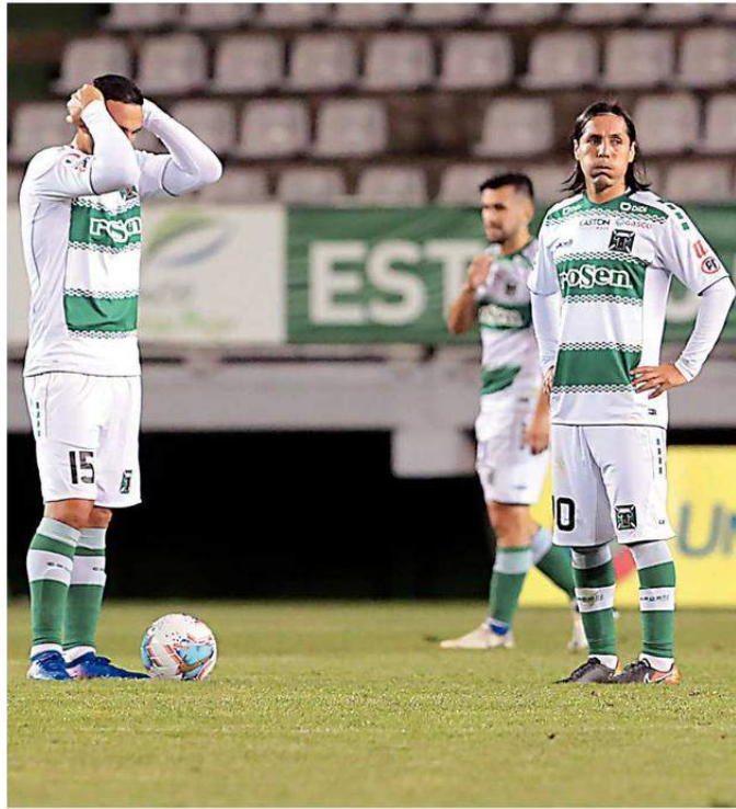
LAS CARAS NO SON BUENAS EN EL PLANTEL DE JUGADORES DEL ELENCO HISTÓRICO, PRODUCTO DE LA CRISIS.

Caso distinto es para aquellos jugadores que son calificados con “contrato indefinido” o después de diciembre de 2020, los que tienen pagos programados en cinco meses, en las mismas fechas reseñadas, más el 24 de julio y 21 de agosto. CS