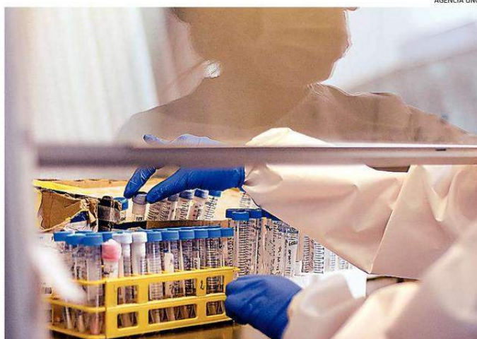
EN LAS ÚLTIMAS HORAS SE PROCESARON 90 MUESTRAS PCR, DE LAS CUALES 16 DIERON POSITIVO A SARS-COV-2.

Del total de casos, existen 63 personas hospitalizadas, de las cuales 32 están en UPC ya sea en UTI o UCI. De estos 32 pacientes, 18 están conectados a ventilación mecánica: 15 en establecimientos de la red pública y 3 en clínicas privadas.