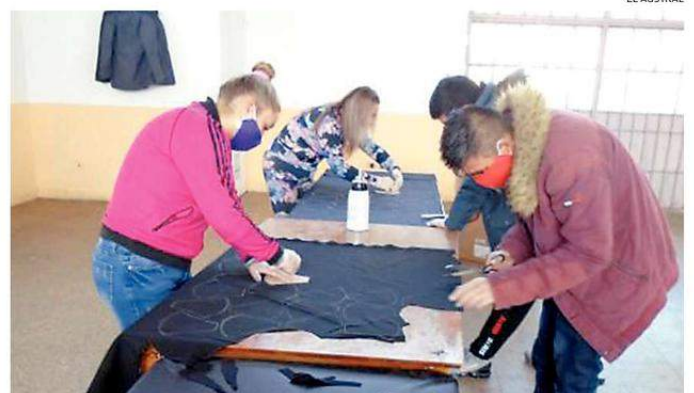
EL TRABAJO QUE SE REALIZA EN LA CONFECCIÓN DE LAS MASCARILLAS.

Además, una parte de estos protectores faciales fue