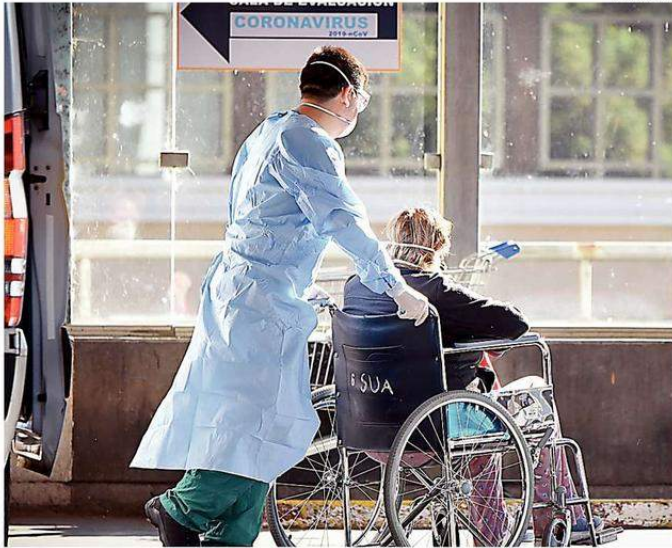
LA GRAN MAYORÍA DE LAS PERSONAS MAYORES FALLECIDAS POR COVID, PRESENTA ENFERMEDADES DE BASE.

La autoridad añadió que frente a esta contingencia, los encargados del hogar han