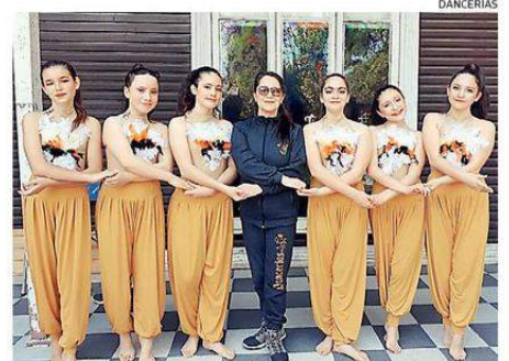
DANCERÍAS SE CARACTERIZA POR CREAR MONTAJES Y PARTICIPAR ACTIVAMENTE DE FESTIVALES Y ENCUENTROS DE DANZA.