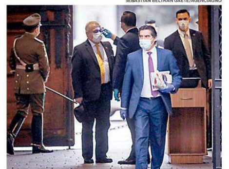
EL MINISTRO DE SALUD, JAIME MAÑALICH, EN SU INGRESO A LA MONEDA.

El estudio observa que en abril hubo mayor número de víctimas mortales y contagios en las regiones más australes de Chile. "La radiación solar UV-B disminuirá en todo el territorio nacional progresivamente hasta fines de junio. A partir de fines de mayo, todos las regiones del país al sur de la Región de