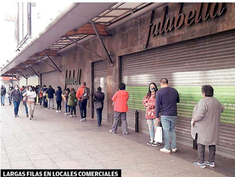
LARGAS FILAS EN LOCALES COMERCIALES

Largas filas es posible apreciar en los locales comerciales de la capital regional, las que tienen explicación en el control y número limitado de personas que pueden entrar como una de las medidas preventivas para evitar el contagio de coronavirus.