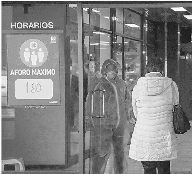
EN EL MALL MIRAGE ACTUALMENTE HAY 38 LOCALES DE LOS 60 QUE ESTÁN ATENDIENDO PÚBLICO.

Pese a que el administrador del Mall Mirage asegura que el recinto no cabe en la categoría de grandes centros comerciales, como el Mall Vivo, Mall Easton o el Mall Portal Temuco, “debido