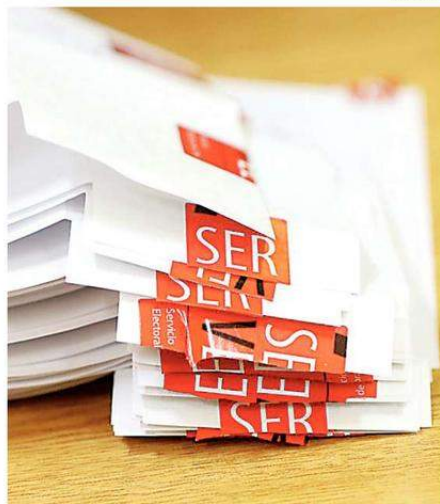
LA ELECCIÓN DE GOBERNADORES ES EL DOMINGO 11 DE ABRIL DE 2021.