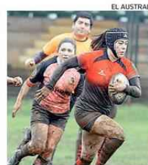
ESTÁ SIN COMPETENCIAS.

Ese instante llegará en la medida que se controle la pandemia en La Araucanía y una vez que ya esté en marcha el protocolo de seguridad en el recinto ubicado al final de calle Matta.