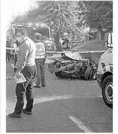
EL HECHO OCURRIÓ A LAS 14 HORAS DE AYER.

● La SIAT de Carabineros investiga un mortal accidente de tránsito registrado ayer en el sector de Pueblo Nuevo, en Temuco. El hecho ocurrió pasadas las 14 horas en la intersección de calles Ziem con Uno Norte, cuando un microbús de la Línea 9 colisionó con un vehículo particular. Producto de la violencia del impacto falleció una mujer de aproximadamente 30 años que se trasladaba en el vehículo menor. Otras siete personas que viajaban en la micro además resultaron con lesiones de diversa consideración.