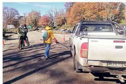
BARRERA SANITARIA INSTALADA EN EL SECTOR DE ICALMA.

ciendo muy complejo analizar e identificar a las personas que tuvieron contacto con confirmados y sospechosos",