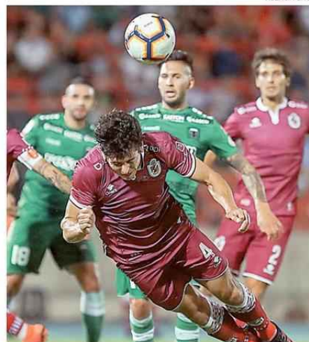
MUY LENTO SERÁ EL PROCESO DE “NORMALIZACIÓN DEL FÚTBOL.”

Lo anterior ha surgido tras conversaciones de las entidades del balompié nacional con las autoridades, avizorándose que en los próximos días se desarrollará una nueva reunión con los Ministerios de Salud y de Deportes, según se informa desde la Anfp. ☞