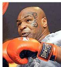
EL EXPÚGIL TIENE 53 AÑOS.