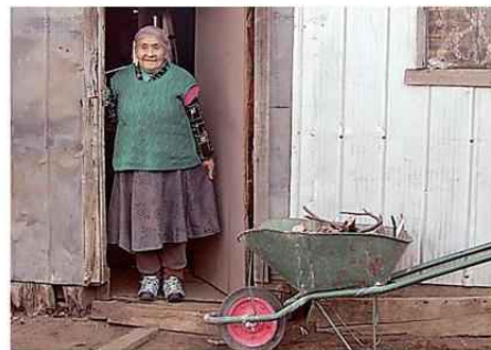
MUCHOS ADULTOS MAYORES VIVEN EN LA SOLEDAD DE LOS CAMPOS.