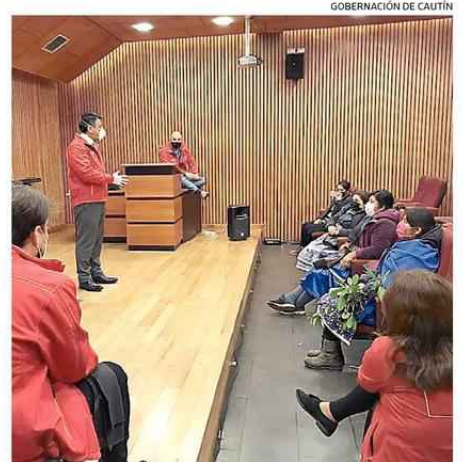
SE INSTAURÓ UNA MESA DE DIÁLOGO CON EL GOBIERNO DE MEDIADOR.

El legislador advirtió en su misiva la diferencia del actuar de Carabineros, poniendo como ejemplo la mediática fiesta de Maipú versus los enfrentamientos de calle Montt.