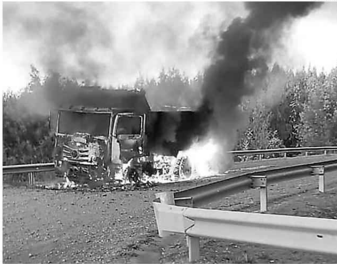
TRES CAMIONES RESULTARON TOTALMENTE DESTRUIDOS Y EL CONDUCTOR DE UN CAMIÓN HERIDO POR UN DISPARO DE ESCOPETA.