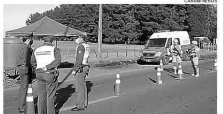
LOS CONTROLES SE EXTENDERÁN POR OTROS SIETE DÍAS.