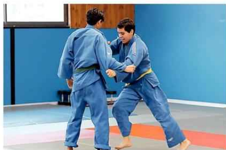
EL JUDO ES UNA DE LAS DISCIPLINAS QUE SE CULTIVA EN EL RECINTO.

del IND ubicadas en Prat y en el Campo de Deportes Ñielol.