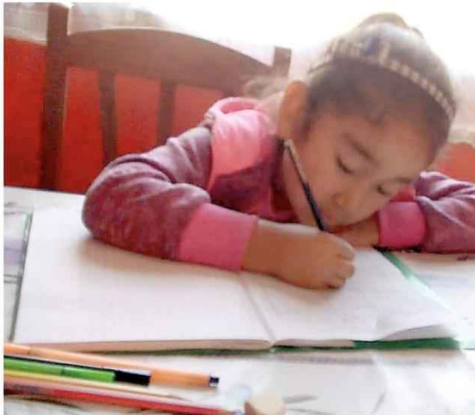
LOS ALUMNOS TRABAJAN CON CARPETAS DE CONTENIDO Y APRENDIZAJE POR ASIGNATURAS Y NIVEL.

82 niños de primero a octavo básico tiene la Escuela rural San Vicente Dehuepille de Padre Las Casas.