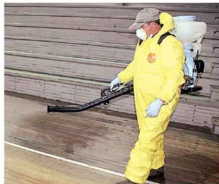
SANITIZACIÓN DE ESPACIOS PÚBLICOS DE LA COMUNA.