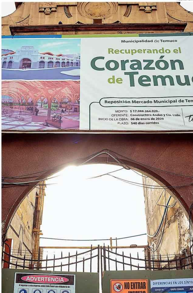
LAS OBRAS SE DETUVIERON CUANDO SE DECLARÓ LA CUARENTENA TOTAL EN TEMUCO Y PADRE LAS CASAS.

"Las obras se detuvieron cuando se declaró la cuarentena y ahora la empresa contra-