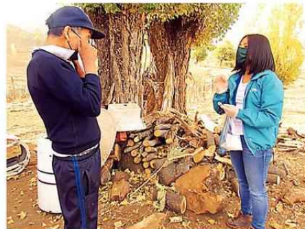
EL HOGAR DE CRISTO DESARROLLA UNA IMPORTANTE LABOR EN LA ZONA CORDILLERANA DE LONQUIMAY.

“Los viejitos no se manejan mucho con la tecnología, así es que muchos están totalmente desconectados de la realidad, no ven noticias o no los entienden. Durante las primeras dos semanas desde el inicio de la emergencia por covid 19, hubo mucho desabastecimiento. Escasó la harina, que acá es clave. La recomendación era no hacer visitas domiciliarias, sino contención a distancia, pero cuesta por el tema de la conectividad y de la falta de destreza tecnológica de