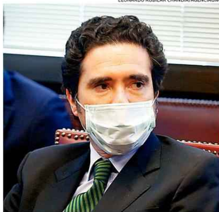
IGNACIO BRIONES, MINISTRO DE HACIENDA.

"Vamos a hacer todo lo que esté a nuestro alcance para que el Ingreso Familiar de Emergencia llegue lo más pronto posible, y eso incluye la posibilidad de un veto presidencial", afirmó el Mandatario y agregó: "El fisco no tiene una capacidad infinita y que está llegando al límite de lo que se puede hacer responsa-