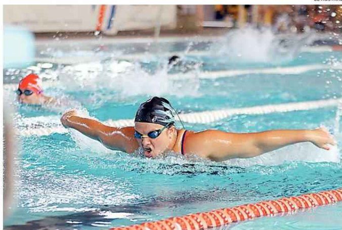
LA NATACIÓN ES UNO DE LOS DEPORTES QUE HA DEBIDO CAMBIAR SU HABITUAL PUNTO DE ENTRENAMIENTO.