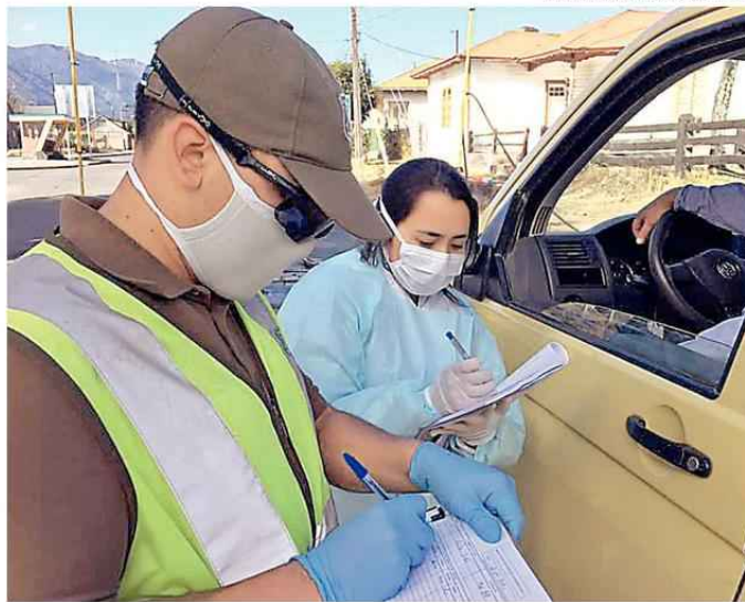
SE HA REALIZADO UN COMPLETO CONTROL DE VEHÍCULOS Y SANITIZACIÓN EN LOS ACCESOS DE LA COMUNA.

La primera autoridad de la cordillerana comuna hizo un símil con un partido de fútbol, se-