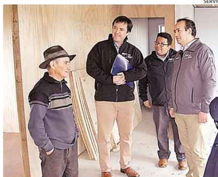
CON ESTO SE PONE FIN A LA LISTA DE ESPERA DE ESTOS PROYECTOS EN LA REGIÓN.

Las comunas beneficiadas en esta oportunidad son Angol, Colipulli, Traiguén, Gorbea, Cuncu, Pitrufquén, Imperial, Freire, Lautaro, Pucón, Padre Las Casas y Temuco.