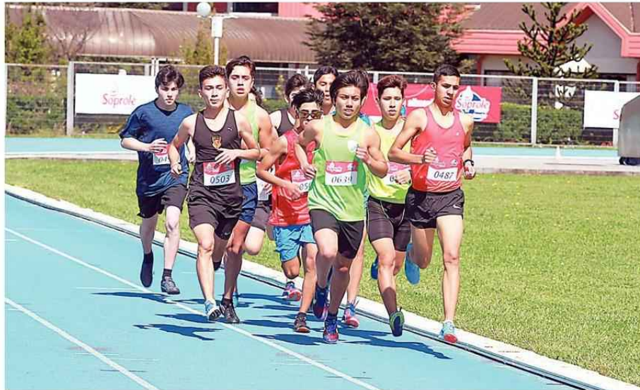
DESDE MARZO ESTÁN CERRADAS LAS INSTALACIONES DEL CAMPO DE DEPORTES ÑIELOL.

"Serán 10 funcionarios los que empezarán a trabajar el lunes", añade la autoridad, que además especifica que en el transcurso de mayo se abrirán progresivamente las oficinas