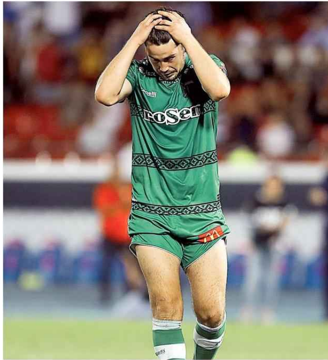
LOS JUGADORES DEL ALBIVERDE ESTÁN DEFINITIVAMENTE INQUIETOS POR LO DE SUS INGRESOS DE ABRIL.

Este retraso en la formalización de los ingresos, vía AFC, aparece justo cuando desde el Gobierno se sabe de la disposición inicial de volver a los entrenamientos presenciales en el mes de junio y un eventual regreso a la competencia en julio próximo (nota secundaria). ☞