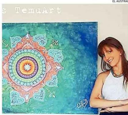
REINVENTARSE. ADAPTARSE, SEGUIR CRECIENDO, SON LAS METAS DE LOS EMPRENDEDORES EN TIEMPOS DE CORONAVIRUS.

Sin duda ha sido un inicio de año difícil, de altos y bajos y lleno de desafíos el que les ha