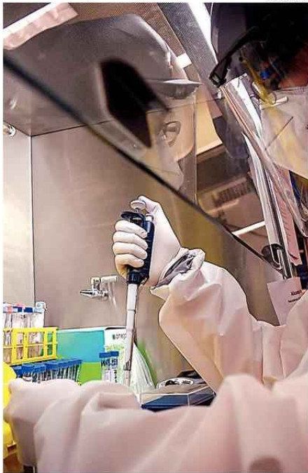
DE LOS 23 NUEVOS CASOS REPORTADOS, 7 PRESENTAN SÍNTOMAS Y 16 SON ASINTOMÁTICOS, SEGÚN INFORMÓ AUTORIDAD SANITARIA.

Al mismo tiempo, recordó que las fiscalizaciones se están efectuando con el debido res-