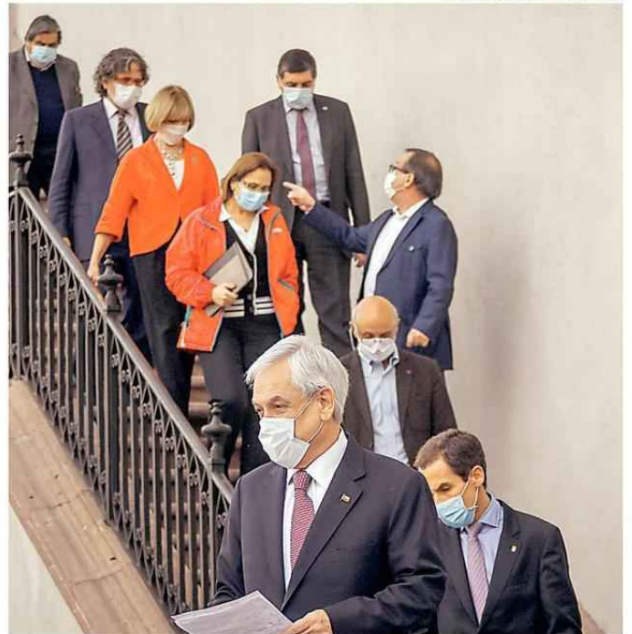
EL PRESIDENTE Y LOS ALCALDES DESPUÉS DE SU REUNIÓN.